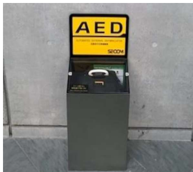
□ AEDの設置(設置場所確認)