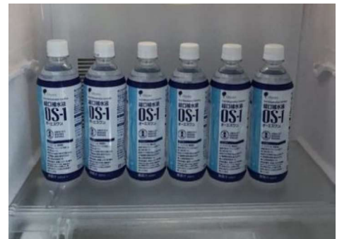
□ 経口補水液等の冷却保管